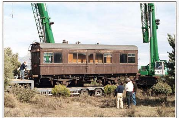
Locomotora "Azucarera de Castilla N° 1"

Entre los vagones recuperados los hay también que fueron propiedad de la multinacional papelería The Northern Pulp Co., establecida en España