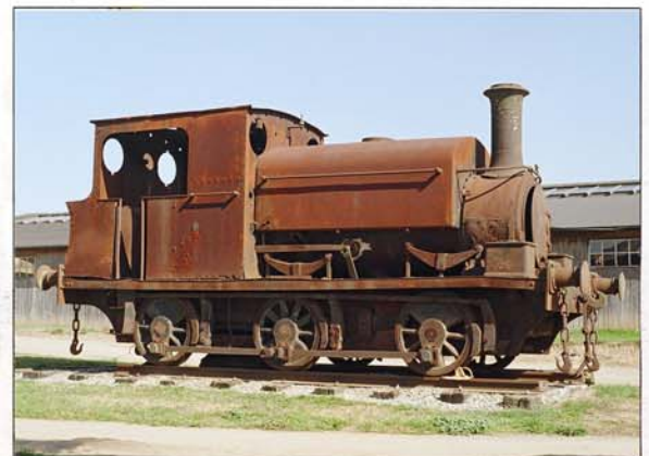
La locomotora "Azucarera de Castilla N° 1" cuando prestaba servicio