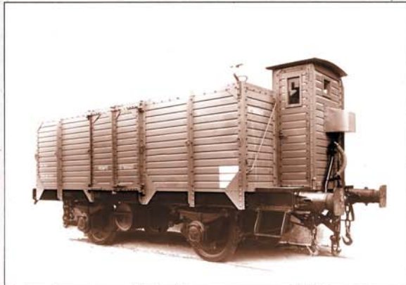
Coche salón para personalidades

Igualmente, el CEHFE ha adquirido tres coches de viajeros. Entre ellos figuran uno de la Compañía del Norte, vincu-