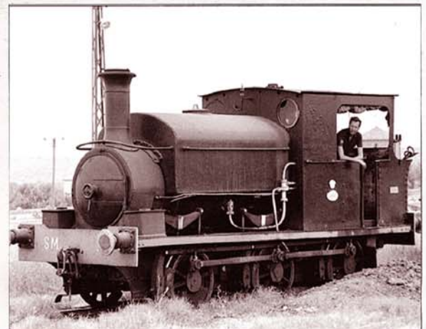
Vagón de bordes altos perteneciente a Nitratos de Castilla S.A.

pero fundada en Wisconsin (EEUU) en 1886 para el suministro de pulpa de madera a los molinos de papel.