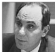
Aleix Vidal-Quadras, vicepresidente primero del Parlamento Europeo (62)