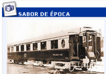
La foto de fábrica muestra uno de los coches-salones Pullman adquiridos para su conservación.