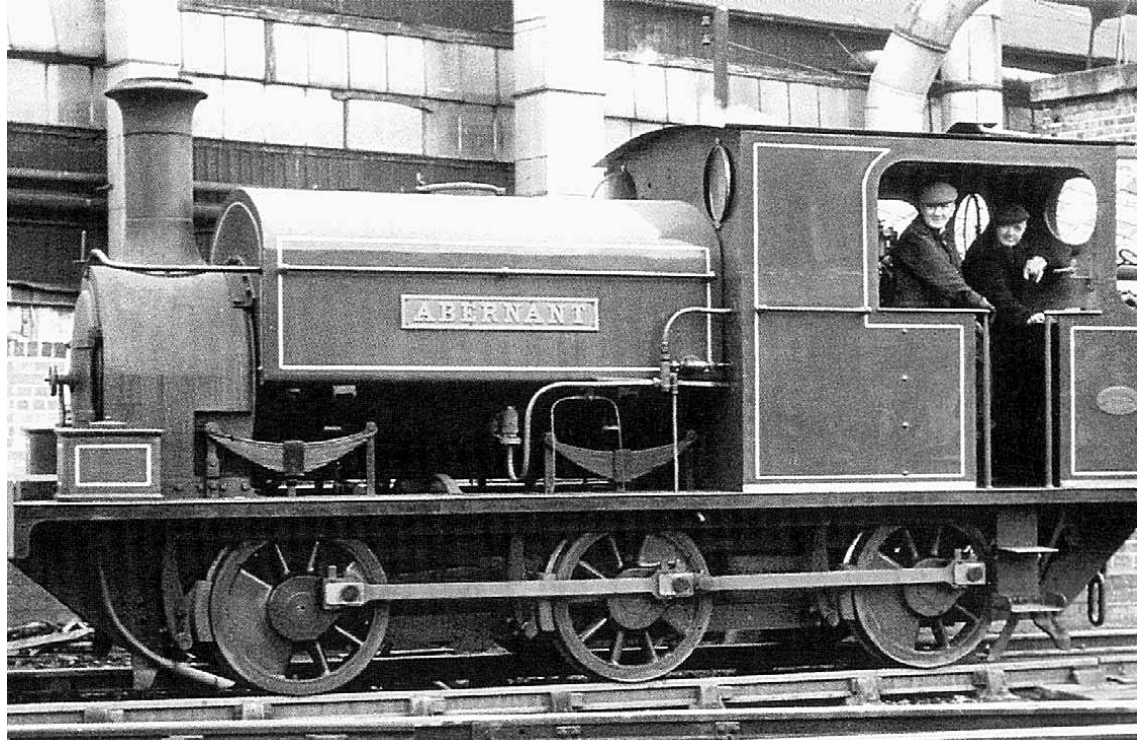
Una locomotora similar a la de la Azucarera de Venta de Baños, que prestaba su servicio en Gran Bretaña.

Tras realizar una intensa labor en la construcción de dicha línea, y una vez acabados los trabajos, la empresa constructora la enajenó y pasó a prestar sus servicios en la Azucarera de Castilla, situada en Venta de Baños. Allí fue numerada como 'Azucarera de Castilla N° 1' y prestó prolongados servicios en el removido de material y la formación de trenes que salían de la importante factoría azucarera palentina.