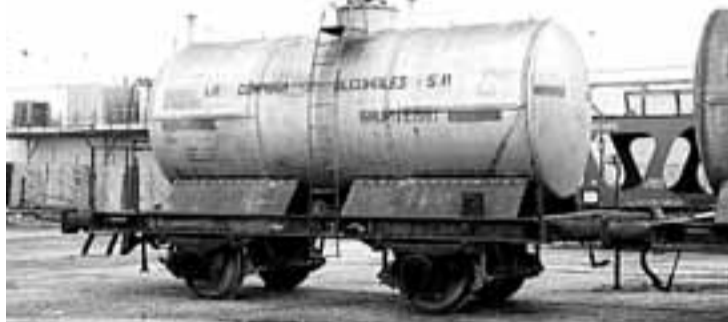
Vagón-cisterna de la empresa Azucarera Ebro en los talleres de Siderúrgica Requena, encargada de su restauración.

la atención es la recuperación de vagones de mercancías de series que se consideraban prácticamente extinguidas en España.