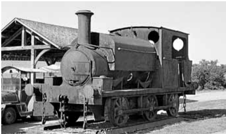
La locomotora conocida como 'Azucarera de Castilla nº1', en Francia a la espera de su repatriación.