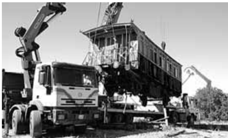
Un momento de la operación de carga del coche de tercera clase de la antigua Compañía del Oeste de España.