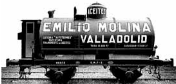
Vagón cisterna de dos ejes perteneciente a la empresa Aceites Emilio Molina.