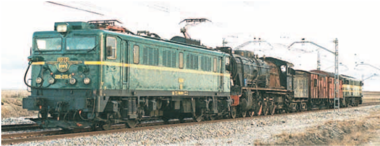
El convoy que arrastró a la locomotora, encabezado por una máquina eléctrica y con una diésel al fondo, a su paso por Valladolid.