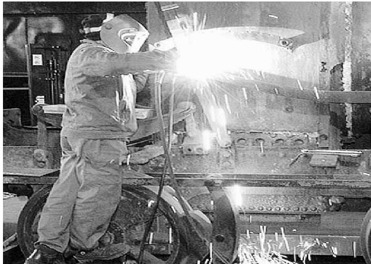
Imagen de la reparación de la máquina.

Esta singular máquina fue comprada por la citada institución y repatriada desde Francia en una compleja operación que permitió