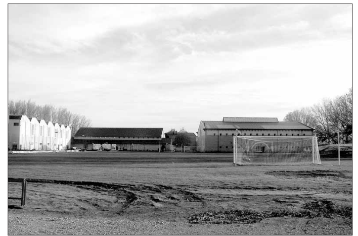
El campo de fútbol de Aguilar contará con nuevos vestuarios.