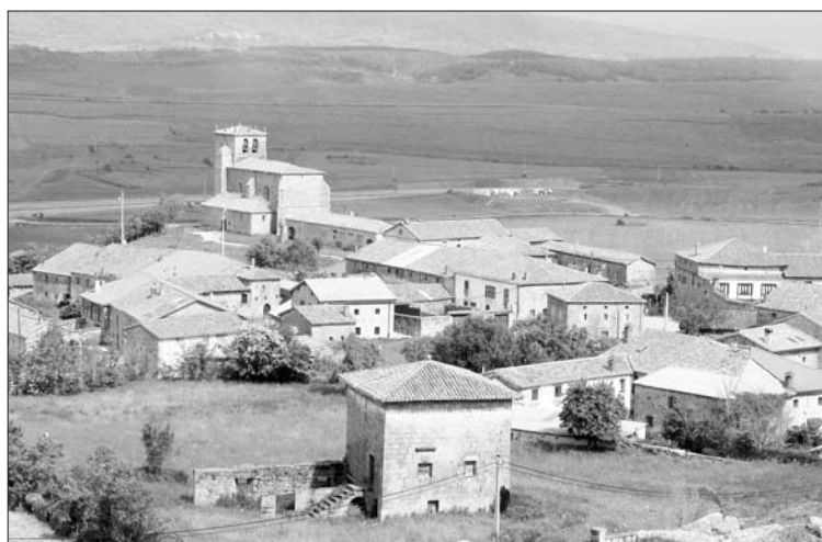
El área de servicio se creará cerca de Villanueva de Henares.

Para poderlo llevar a cabo, ya han solicitado la colaboración del