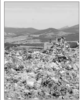
Vertedero de Aguilar de Campoo.