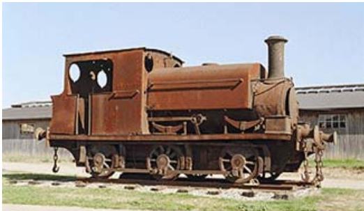
Locomotora Nº 1 de la antigua Azucarera de Castilla.

Dentro de sus habituales labores de recuperación de antiguo material de ferrocarriles, el Centro de Estudios Históricos del Ferrocarril Español ha procedido en los últimos meses al rescate de diversos vehículos de gran valor cultural vinculados a la historia ferroviaria de Castilla y León. Todos ellos están entrando en un proceso de restauración, para pasar a utilizarse en actividades de tipo turístico y cultural. Dichos vehículos van desde locomotoras hasta vagones de mercancías de diversos tipos, pasando por varios coches de viajeros.