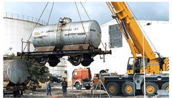
Carga de uno de los vagones-cisterna de Azucarera Ebro .

Importante papel en este proceso de restauración desempeña Siderúrgica Requena S.A. , con 75 años de experiencia en el sector y empresa patrocinadora de este tipo de actividades culturales, en cuyos talleres de Villaverde (Madrid) se trabaja ya intensamente en varios de los vehículos mencionados.