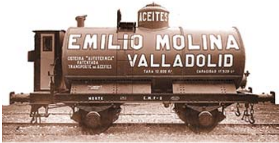
Vagón cisterna de Aceites Emilio Molina , de Valladolid.

Factorías en manos de la actual Azucarera Ebro , principal productor y comercializador de azúcar de España que, tras su fusión con PULEVA, constituye el primer grupo de alimentación español. Tras la adquisición de todo este material, el Centro de Estudios Históricos del Ferrocarril Español ha trasladado ya o se encuentra trasladando a talleres los diferentes vehículos para su