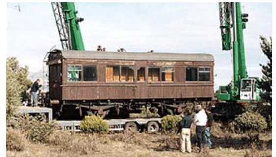
Carga del coche S-3 de la antigua Cía. del Oeste de España.

Tras intensas gestiones se han conseguido localizar y rescatar para nuestro patrimonio histórico varios vagones cerrados, vagones de bordes y vagones-cisterna.