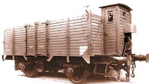
Modelo de vagón utilizado por Nitratos de Castilla S.A.

Esta empresa, surgida tras la guerra civil para la producción de abonos nitrogenados, vino a llenar el vacío existente en España hasta aquel entonces para llegar a convertirla en exportadora de